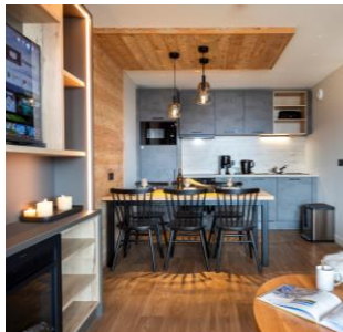
Appartements équipés exclusivement de lits au sol