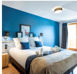
Vue et emplacement remarquables, décoration soignée, équipements et services supplémentaires

Notre engagement RSE Nos produits utilisés pour l'entretien du Club sont tous écolabellisés pour une meilleure qualité de l'air et moins de risque pour la santé.