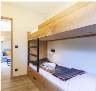
Appartements équipés de lits superposés dans la seconde chambre