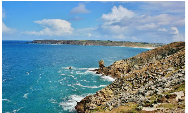
Pointe du Raz

De 9h à 12h et de 17h à 19h, tous les jours. Sauf le dimanche après-midi et le mercredi toute la journée. (Arrivée le samedi entre 17h00 et 20h00 et départ le samedi avant 10h00). Merci de prévenir la résidence en cas d'arrivée tardive.