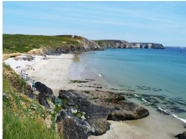
Pointes de Toulinguet