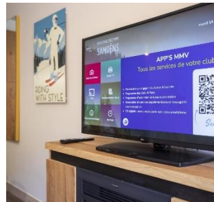
Vue et emplacement remarquables, décoration soignée, équipements et services additionnels