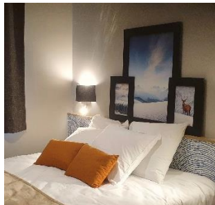
Appartements équipés exclusivement de lits au sol